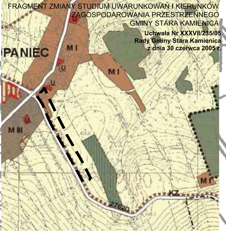
FRAGMENT ZMIANY STUDIUM UWARUNKOWAŃ I KIERUNKÓW ZAGOSPODAROWANIA PRZESTRZENNEGO GMINY STARA KAMIENICA Uchwała Nr XXXVII/235/05 Rady Gminy Stara Kamienica z dnia 30 czerwca 2005 r.